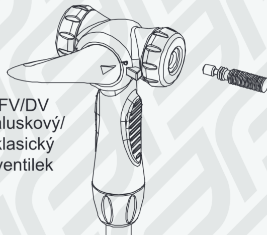
FV/DV galuskový/ klasický ventilek

Dodavatel / Importer / Поставщик KCK Cyklosport-Mode s.r.o. Bartošova 348, 765 02 Otrokovice-Kvitkovice, CZ www.kckcyklosport.cz , www.force.cz Země původu Taiwan / Made in Taiwan / Страна происхождения Тайвань