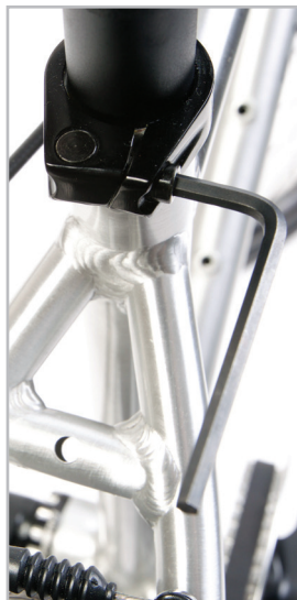
BELTER 20 URBAN 3

Na sedlovce je vyznačena maximální povolenou výška vysunutí. Z bezpečnostních důvodů nikdy nevysouvejte sedlovku nad tuto značku.