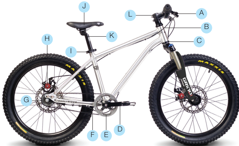
BELTER 20 TRAIL 3S