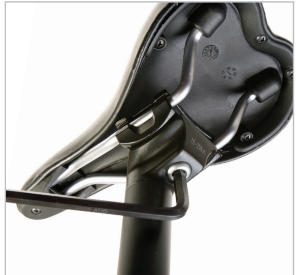
BELTER 20 URBAN 3

Pro nastavení jednoduše povolte inbusovým klíčem šroub pod sedlem na horním konci sedlovky (viz obrázek). Po povolení šroubu můžete sedlo posouvat dopředu a dozadu a také měnit jeho sklon. Po nastavení požadované pozice utáhněte šroub a můžete vyjet.