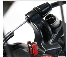
BELTER 20 TRAIL 3 & 3S