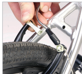
BELTER 20 URBAN 3

Pro opětovné připojení brzd přitlačte brzdové čelisti k ráfku a zasuňte kovový vodič bowdenu zpět. Ujistěte se, že je vodič bowdenu správně nasazen a že je druhý konec brzdového lanka zcela zasunut do otvoru v brzdové páce. Při opotřebení můžete brzdy seřídit pomocí povolení nebo dotáhnutí nastavovacího dutého šroubu s kolečkem na brzdové páce. Ujistěte se, že brzdový špalek správně přiléhá k ráfku. Seřízení Vám zabere jen chvíli a předejdete tak pozdějším problémům.