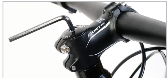
BELTER 20 URBAN 3