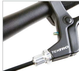
BELTER 20 TRAIL 3 & 3S

PRO DALŠÍ INFORMACE A TIPY PRO ÚDRŽBU SI STÁHNĚTE UŽIVATELSKOU PŘÍRUČKU AVID BB5 ZE STRÁNKY EARLYRIDER.COM/MANUALS