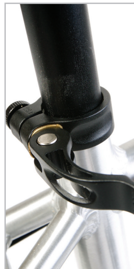
BELTER 20 TRAIL 3 & 3S