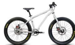
BELTER 20 TRAIL 3