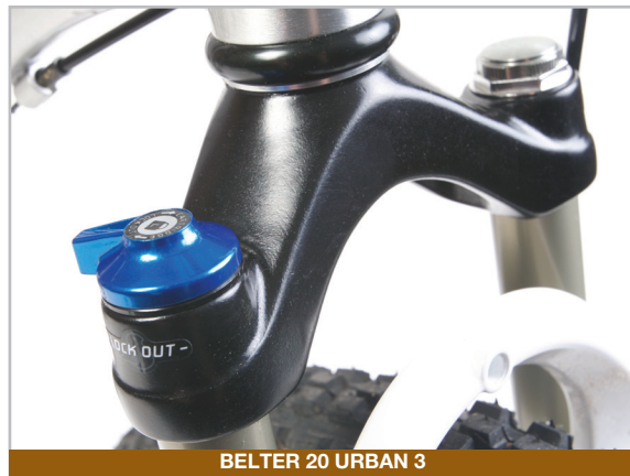
BELTER 20 URBAN 3

PRO DALŠÍ INFORMACE A TIPY PRO ÚDRŽBU SI STÁHNĚTE UŽIVATELSKOU PŘÍRUČKU SPINNER GRIND ZE STRÁNKY EARLYRIDER.COM/MANUALS