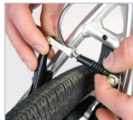
BELTER 20 URBAN 3