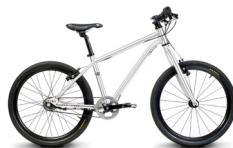
BELTER 20 URBAN 3