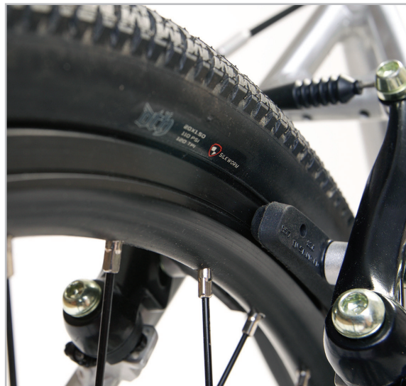
BELTER 20 URBAN 3

Roztočte kola a ujistěte se, že se brzdové špalčky nedotýkají ráfku. Případné drhnutí se obvykle dá odstranit nastavením pozice brzdy. Proměnlivý odstup mezi ráfkem, pláštěm a brzdovými špalčky při roztočení kola (tzv. osmice) by měl být odstraněn kvalifikovaným servisním technikem. Mějte na paměti, že brzdový špalek drhnoucí přímo o pneumatiku může při jízdě způsobit vážnou nehodu.