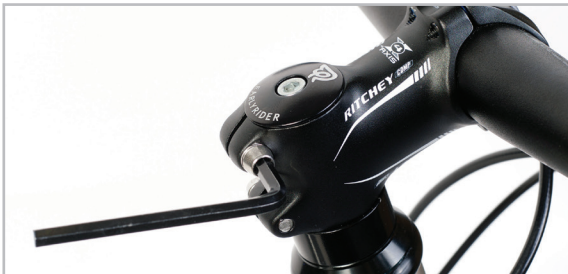
BELTER 20 URBAN 3

VAROVÁNÍ! Uvolněné hlavové složení může způsobit vážnou nehodu - před jízdou na kole se ujistěte, že s ním nebylo nijak manipulováno. V případě dotazů kontaktujte prodejce.